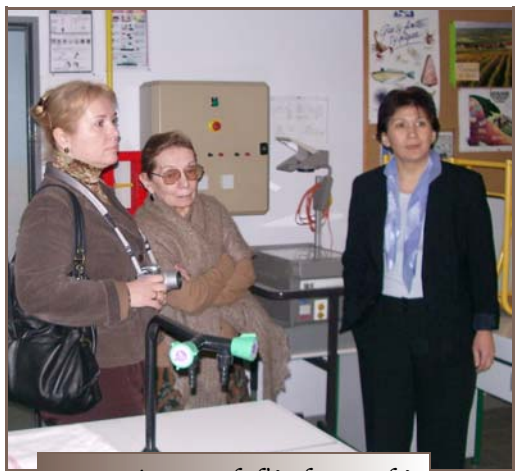
Des enseignants de l'école Coryphée