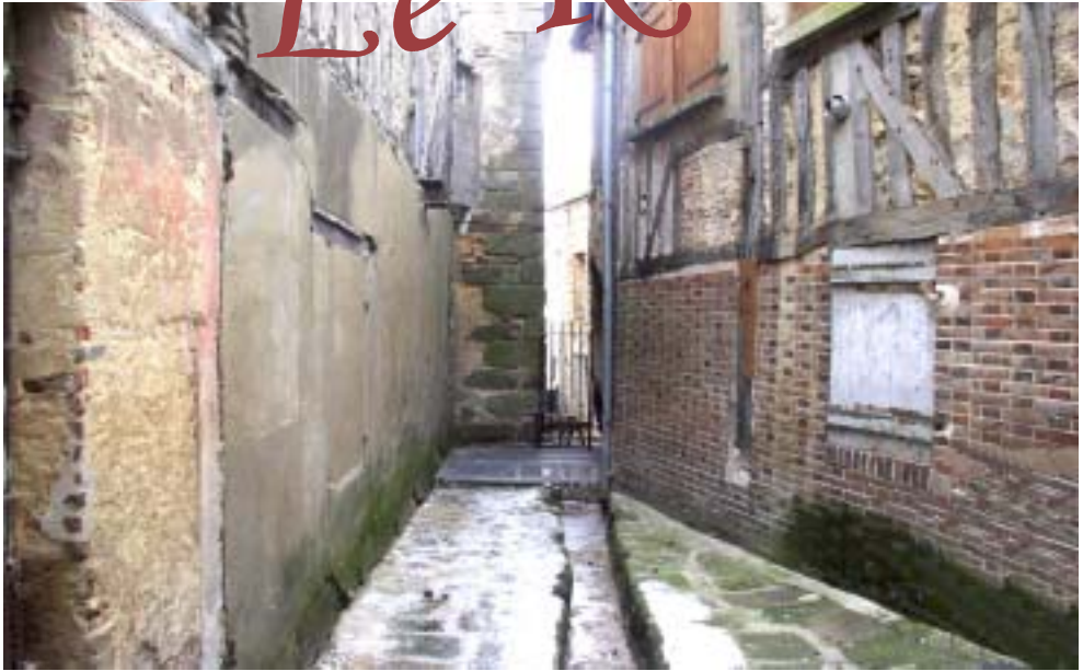
A Sézanne: le Ru des Auges à son passage par le Moulin de la Ville

Le patrimoine industriel est en train de gagner le grand public, et cette constatation nous encourage à poursuivre notre effort.