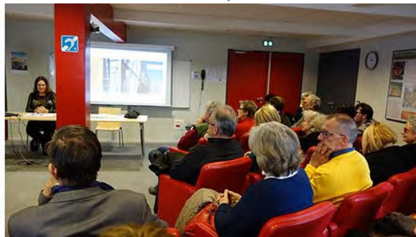
puis à Charleville